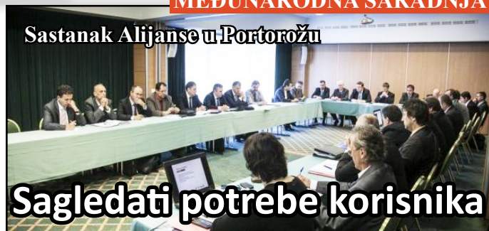
Sastanak Alijanse u Portorožu

Zamjena krovnog pokrivača izvršena je na staničnoj zgradi Bukovac, Kreka, Lukavac i magacin Kreka. Na zgradi direkcije PP Tuzla urađena je termička fasada, zamjenjena stolarija i izvršena zamjena krovnog pokrivača. Osnovni cilj rekonstrukcija zgrada je poboljšanje termičke i zvučne izolacije, što će se u narednom periodu reflektovati kroz uštede energenata za zagrijavanje radnog prostora. A željezničari su dobili ljepše i bolje uslove za rad.