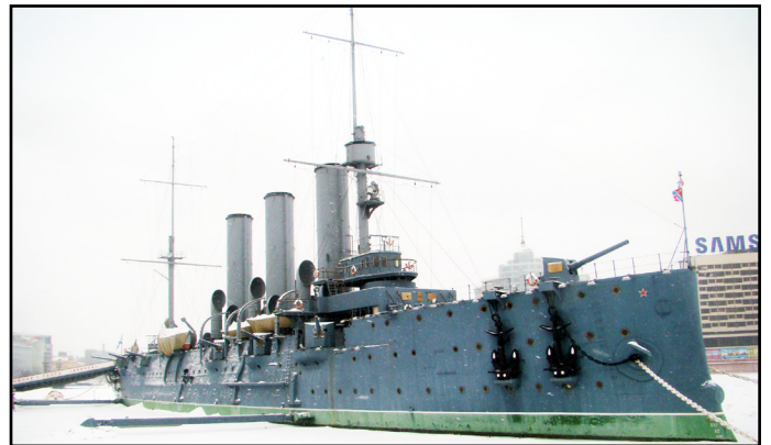
Čuvena Krstarica Aurora iz Oktobarske revolucije usidrena je na Nevi kao muzej

Na Međunarodnoj konferenciji o putničkom saobraćaju FTE B koja je održana u Sankt Peterburgu u Rusiji, u periodu od 25. do 29. marta 2013. godine, prisustvovali su i predstavnici Željeznica FBiH.