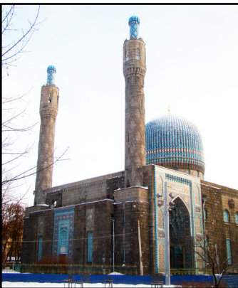
Džamija u Sankt Peterburgu podignuta 1913. godine